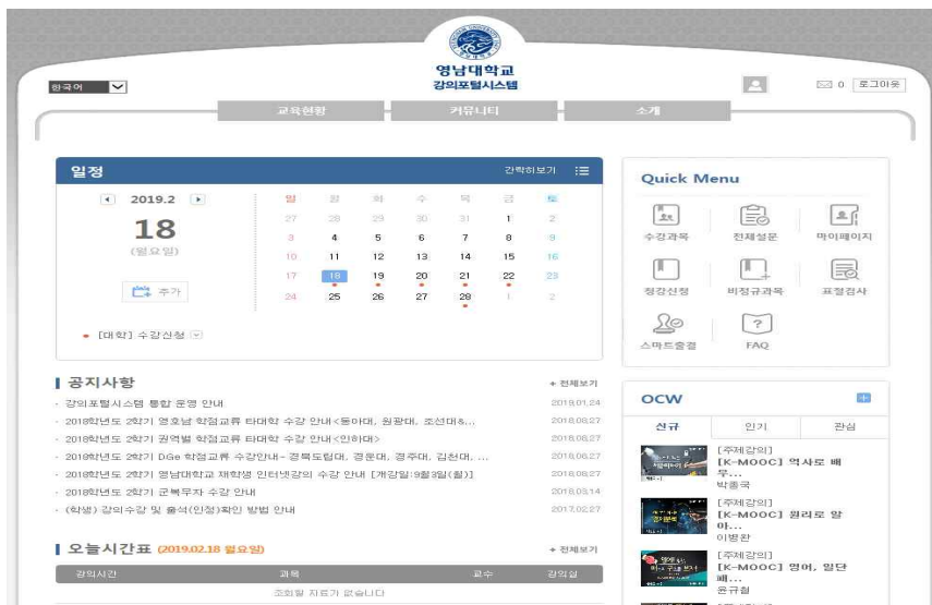
[그림 3] 강의포털시스템 화면